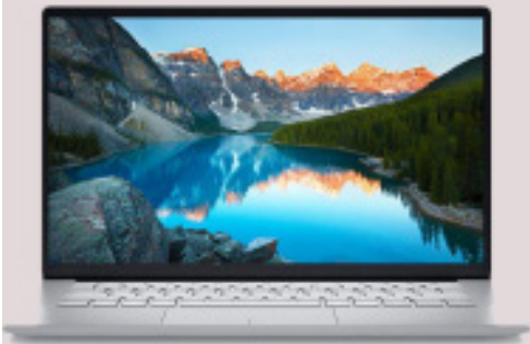
جهاز كمبيوتر محمول للجغرافيكس 4,000 AED