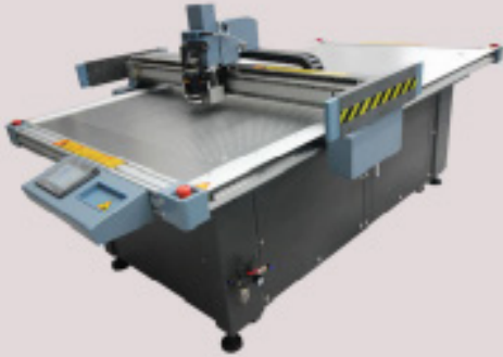
اله لتصنيع الصناديق 3,500 AED