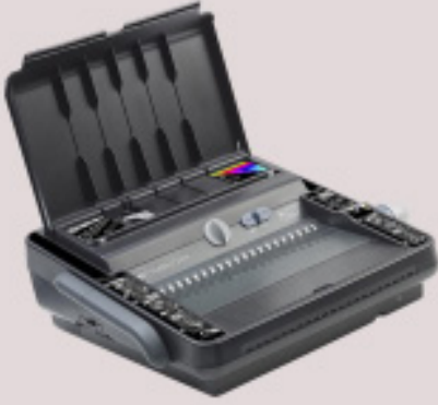
ماكينة للتغليف ( متعددة الصفحات ) 1,800 AED