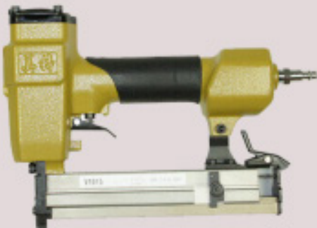
اله غراء احترافيه 1,000 AED